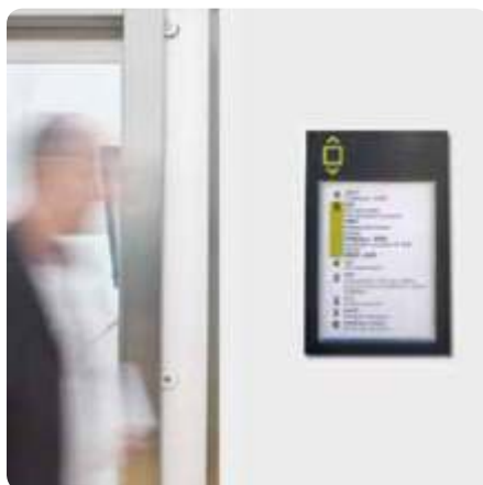
Infinity Basic Paperflex