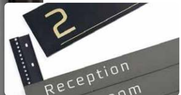
Infinity Classic guías