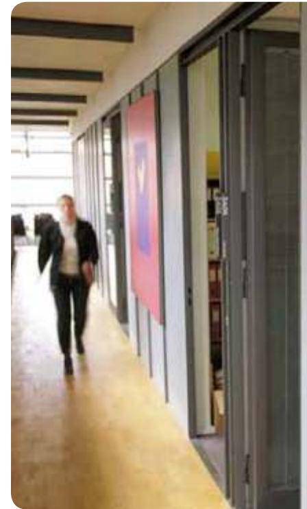
Infinity Classic grid