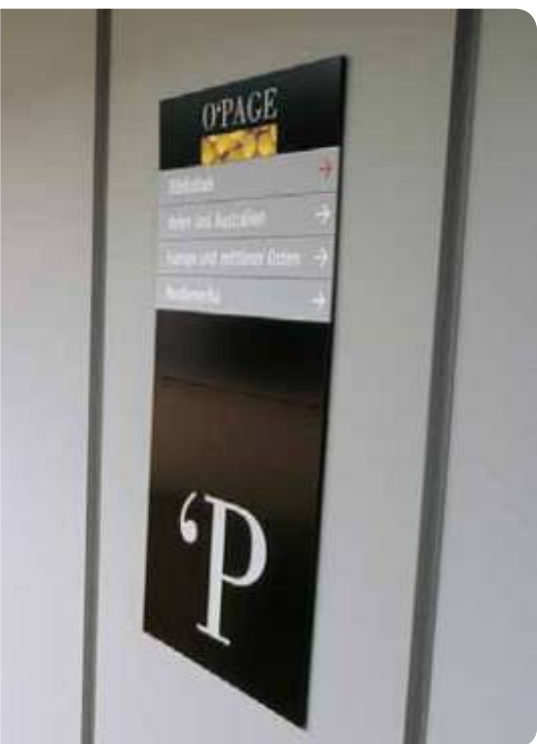
Infinity adosado sobre grid

Nuestra nueva tecnología de impresión sobre panel abre aún más posibilidades. Este sistema de impresión digital directa puede imprimir todos los colores, incluso blanco, ofreciendo al diseñador una libertad gráfica total y un acabado de calidad real.